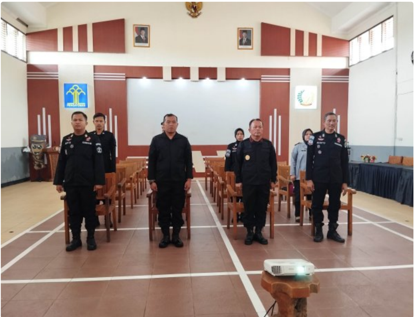
Blora - Rumah Tahanan Negara (Rutan) Kelas IIB Blora mengikuti rangkaian